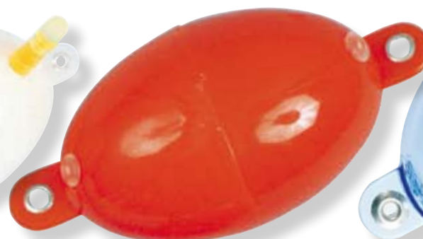
N°5 - Ø 45 mm - 60 g