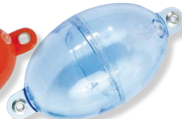
N°6 - Ø 50 mm - 80 g