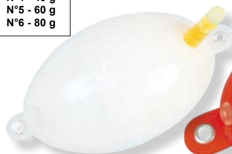
N°4 - Ø 40 mm - 40 g

N°1 - 8 g N°2 - 15 g N°3 - 30 g N°4 - 40 g N°5 - 60 g N°6 - 80 g