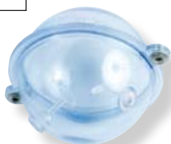
N° 1 - Ø 25 mm - 8 g

N°1 - 8 g N°2 - 15 g N°3 - 30 g N°4 - 40 g N°5 - 80 g