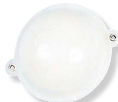
N° 3 - Ø 40 mm - 14 g