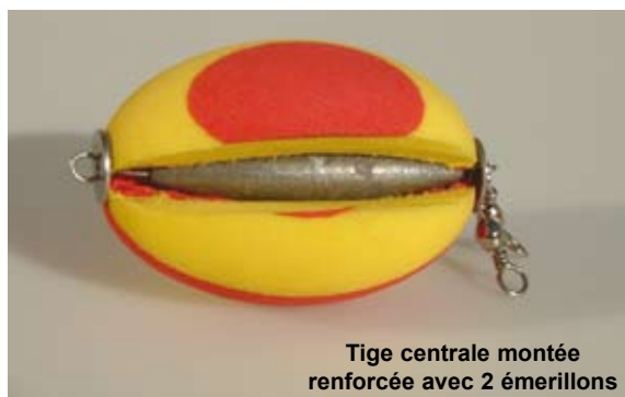
Tige centrale montée renforcée avec 2 émerillons

Conçu en mousse double densité, ce modèle résiste aux chocs et neutralise les rebonds sur les rochers, ce qui permet de pêcher très près des endroits où le Bar est à l'affût.