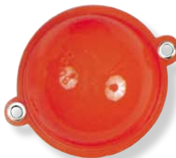
N° 2 - Ø 30 mm - 14 g